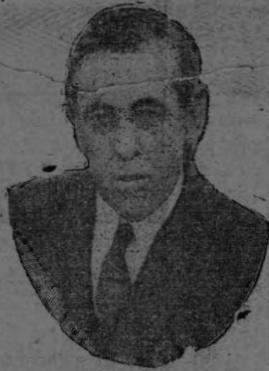
WOODROW WILSON Actual Presidente de los Estados Unidos.

Décimo sexto Presidente. De marzo 4 de 1861 a marzo 4 de 1865.